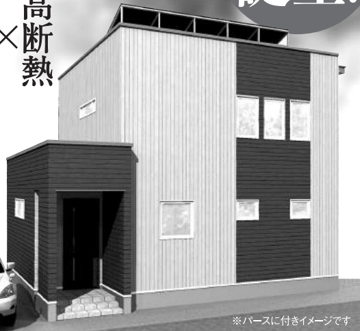
※パースに付きイメージです

家計を助ける ● 売電収入 太陽光パネル4.5KW 毎月 11,741円 の収入 ※Panasonic エネヒタにて北海道釧路で太陽光パネル4kW程度を載せた場合で試算。 年間予測発電量5.032kWh/年×売電単価28円/12ヶ月=売電収入月々11,741円