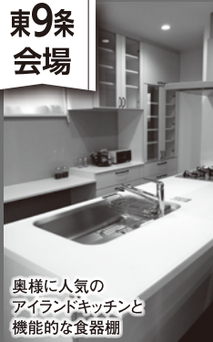
奥様に人気の アイランドキッチンと 機能的な食器棚