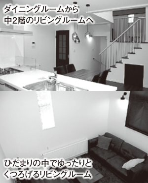
ダイニングルームから 中2階のリビングルームへ