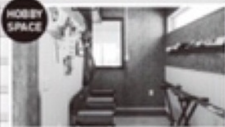
HOBBY SPACE 様々な用途に合わせて使える趣味の部屋。