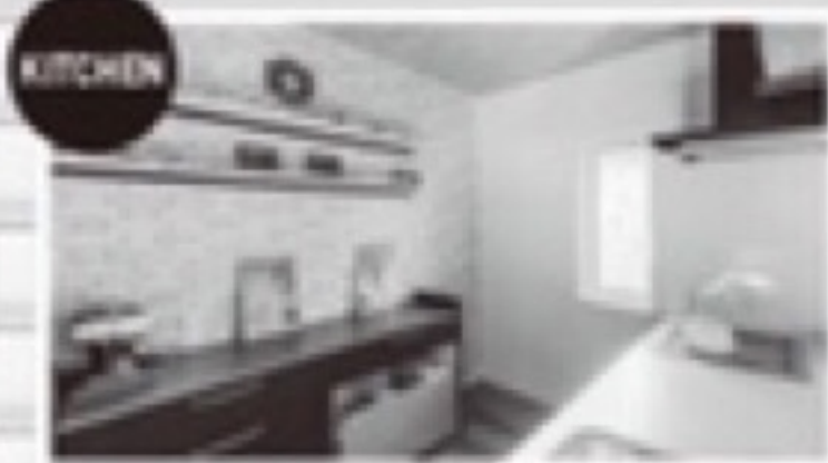
KITCHEN リビング全体を見渡せるキッチンスペース。