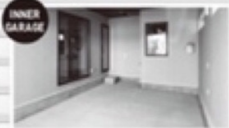
INNER GARAGE 荷物の搬出・搬入に便利なインナーガレージを完備。